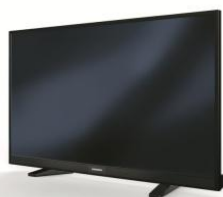
TELEVISOR LED 32" GRUNDIG