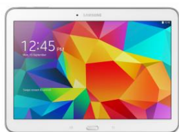
TABLET 10.1" 16GB SAMSUNG - WiFi.

Si sale premiado puede elegir uno de estos fabulosos PREMIOS :