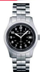
RELOJ CABALLERO HAMILTON