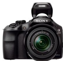
CÁMARA DE FOTOS 20,1" MP SONY