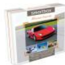
SMARTBOX MÁXIMA EMOCIÓN